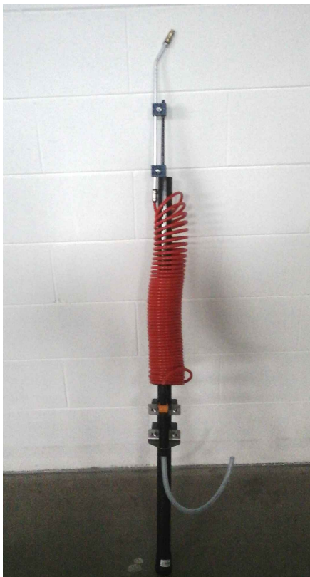
PERTICA DA 7 m