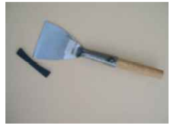
SCALPELLO PER PULIZIA STIPITE