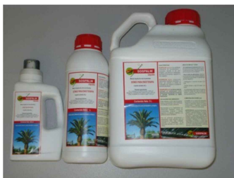
CONCIME LIQUIDO SOSPALM