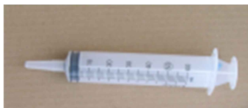
SIRINGA 60 ml