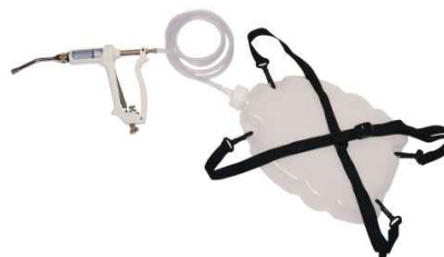
SERBATOIO CON SIRINGA AUTOMATICA