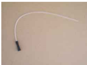
TUBO PER SIRINGA