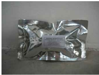
EROGATORE DI FEROMONE