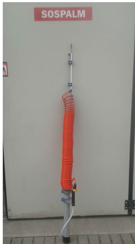
PERTICA DA 11 m