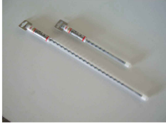
PUNTA PER TRAPANO